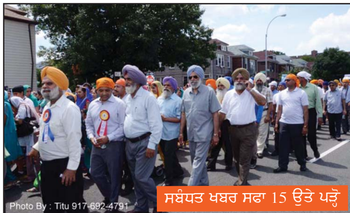
ਸਬੰਧਤ ਖਬਰ ਸਫਾ 15 ਉੱਤੇ ਪੜ੍ਹੋ